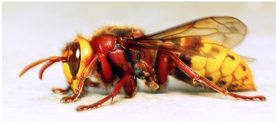
"Hornet ( Vespa crabro )"

Die einzige in Europa heimische Hornissenart ist die Vespa crabro .