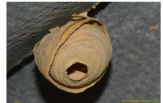
" Vespa velutina - étape 2 - nid de frelon asiatique ! COURS (34)"

Im Frühjahr baut die Vespa velutina zunächst kleine Primärnester, die auch in geringer Höhe zu finden sind.